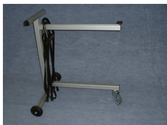
TROBO (10 sièges)