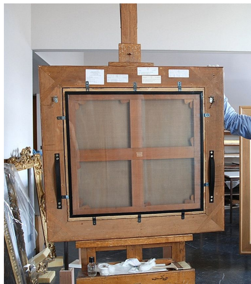
Profil Z en situation

Sur commande et par quantités, autres hauteurs possibles (3,2 / 9,5 / 12,7 mm).